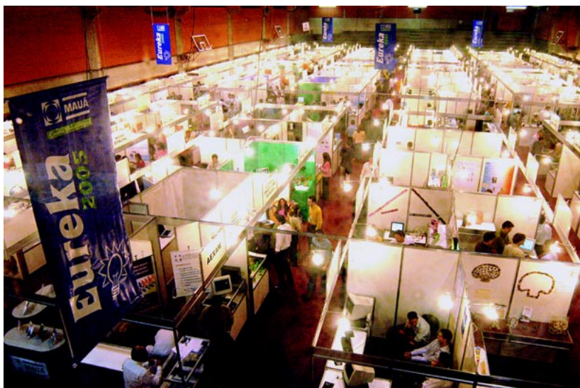
EUREKA 2005 - EXPOSIÇÃO DOS TRABALHOS DE GRADUAÇÃO